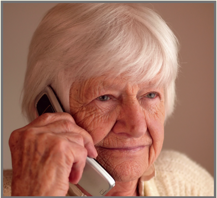
Information, Beratung und Unterstützung im Alter, bei Krankheit und Pflegebedürftigkeit